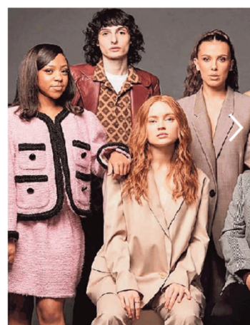
I protagonisti della serie Stranger Things, giunta alla c