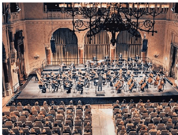
La Fvg orchestra chiuderà la rassegna domenica 19 giugno