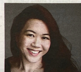
La soprano Teng Xiang Ting (Singapore)