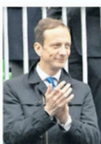
FRIULI Massimiliano Fedriga

► In cinque anni il territorio ha triplicato gli investimenti provenienti dalle altre Nazioni: merito della politica fiscale ► La quota in ingresso è passata dal due al sei per cento Fedriga: «Premiata la nostra lungimiranza, ora accelerare»