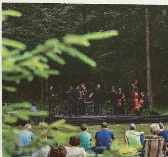
L'Orchestra giovanile Filarmonici Friulani in Val Saisera