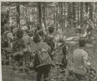
LA MUSICHE TAL BOSC E LA SOPRAN TENG XIANG TING

◆ E no dome ospits di dut il mont, ma ançe musiche di divignence diferente di chel antiche, ae classiche, romantiche, contemporane, al tango, al flamenco, al country e bluegrass, ae musiche mariachi, ae improvisazion, scjavançant secui e latitudins cun musiciscj e grups che a vegin dal Friûl, de Italie, Cravuzie, Spagne, Andalusie, Singapor, Persie, Messic, Ecuador, Bolivie, Perù e Stâts Unîts.