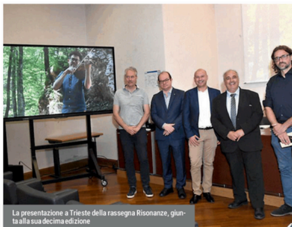
La presentazione a Trieste della rassegna Risonanze, giunta alla sua decima edizione

E ci saranno anch'essi, riuniti nell'Officina dell'Arte di Legno Vivo, nel cuore di Mal-